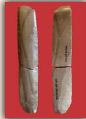
Katillotxu I-eko hilobi ostilamendua: armadura geometrikoak, aizkora leundua eta ijeki edo aiztoa. / Ajuar funerario de Katillotxu I: armaduras geométricas, hacha pulimentada y lámina o cuchillo.