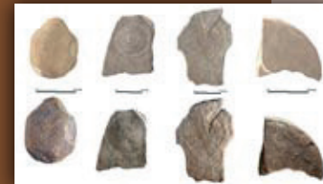
(3) Tumuluko hilarrien kalkoa eta argazki-lehengoratztea. / Calco y restitución fotográfica de las estelas del túmulo.