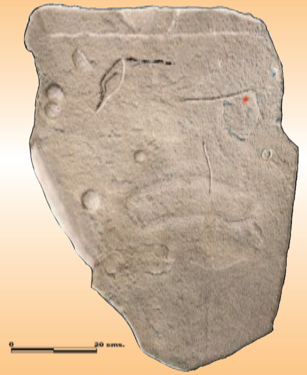
(1) Katillotxu V burualdeko harlauza / Losa de cabecera de Katillotxu V