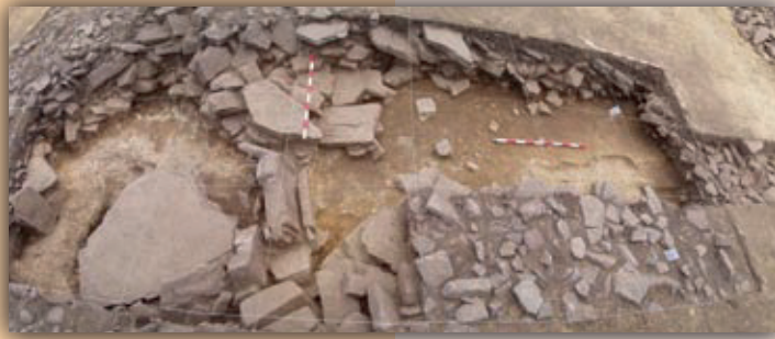
Ebakidura estratigrafikoa hegoaldeko sektorean. / Corte estratigráfico en el sector Sur.

El monumento de Katillotxu I mide 18 m de diámetro por 0,90 m de altura. La cámara funeraria conserva 8 losas de su estructura, definiendo un recinto de planta rectangular-polygonal, orientada de Norte a Sur, y con unas medidas de 2,5 por 1,5 metros. La totalidad del monumento, túmulo y cámara sepulcral, se construyó esencialmente a base de bloques de arenisca, mostrando una estructura interna bien organizada. La cámara sepulcral está delimitada por una corona de grandes bloques en posición subvertical. El túmulo se construye a base de losas colocadas en posición subhorizontal, imbricadas entre sí y con una ligera inclinación hacia el centro del monumento.