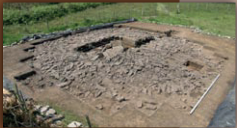
Katillotxu V monumentua, indusketa arkeologikoa ondoren. / Monumento de Katillotxu V tras la excavación arqueológica.

El dolmen de Katillotxu V fue descubierto en 2002 por miembros de AGIRI Arkeologia Elkarte y su excavación arqueológica se llevó a cabo entre los años 2006 y 2008, bajo la dirección de J.C. López Quintana y A. Guenaga Lizasus.