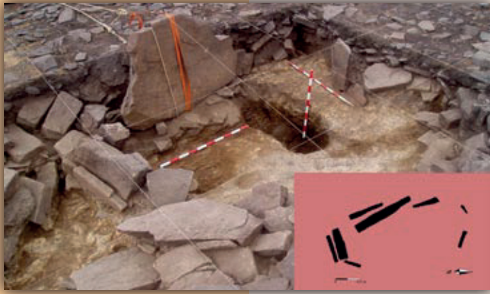
Ganbararen kontserbazio egocaren xehetasuna. / Detalle del estado de conservación de la cámara.