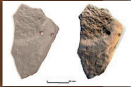
(2) Ganbarako 1 hilarriaren kalkoa eta argazki-lehengoratztea. / Calco y restitución fotográfica de la estela camerale I.

El dolmen de Katillotxu V no ha conservado restos humanos por la acidez del suelo. Y el ajuar arqueológico asociado al uso funerario del monumento se limita a una lámina de sílex, localizada en el interior de la cámara, donde no se han constatado evidencias de remociones o saqueos. Un ajuar funerario pobre, que contrasta con la riqueza gráfica y la organización simbólica del megalito.